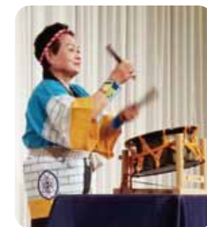
感染対策を万全に恒例「クリスマス例会」を開催。会員による素晴らしい芸披露を楽しみました。