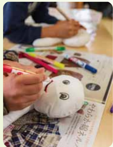
ドール作りも楽しめました♪